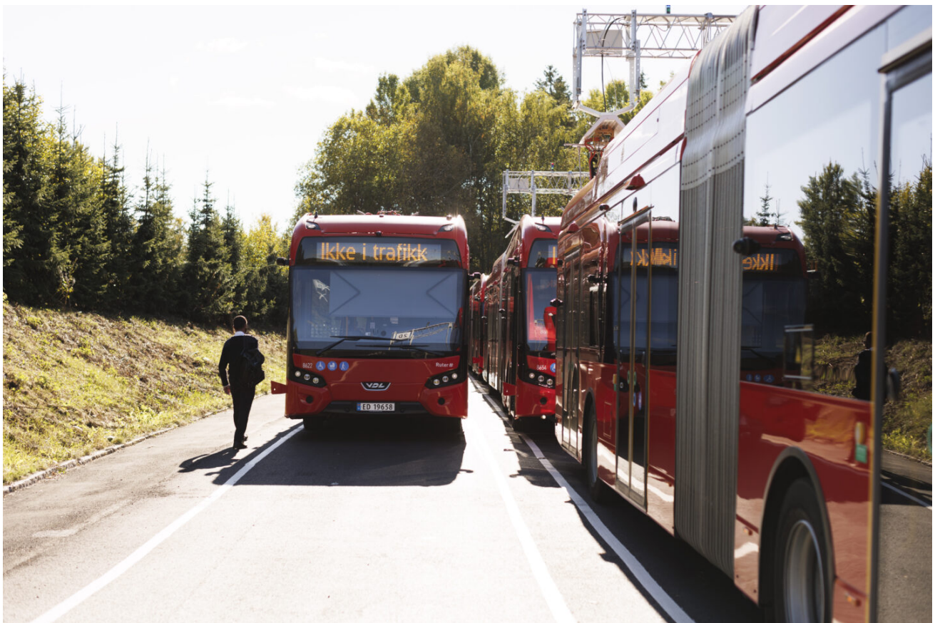
Nye elektriske busser lader på det nye bussanlegget på Rosenholm.