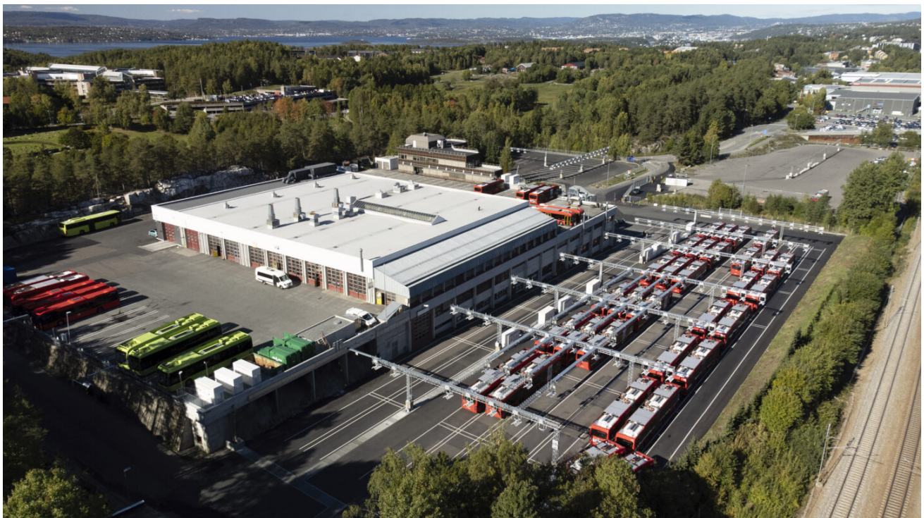
Det nye bussanlegget på Rosenholm sett ovenfra.